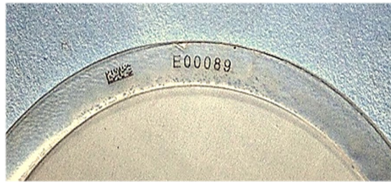
サポートリング上にナンバリング/バーコード付