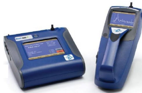
デスクトップ(ポータブル)型