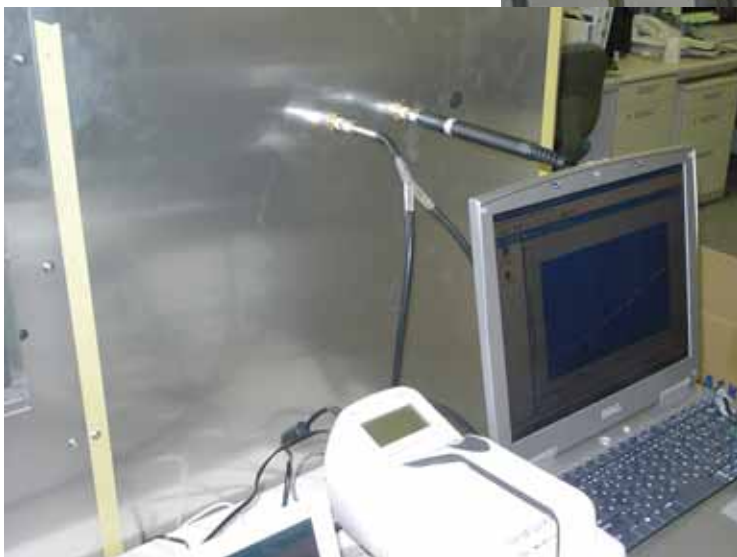
粒子のサンプリングポイント