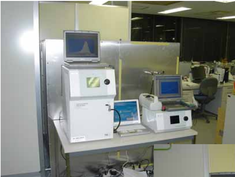
アルミチャンバーと実験機器