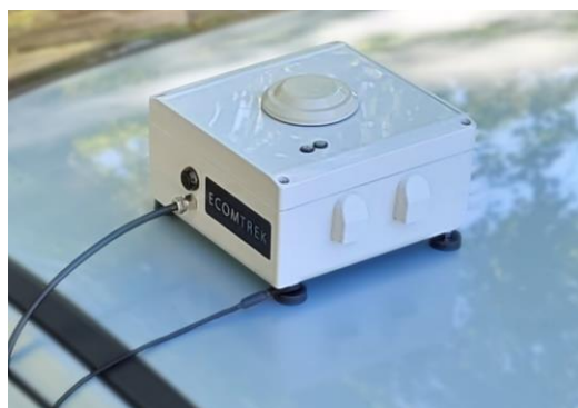
4G/LTE-Mでリアルタイムにデータ送信