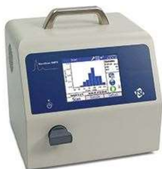
Nano Scan SMPS3910