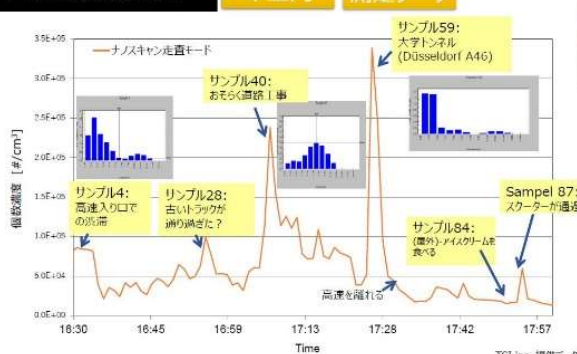
市街地走行時のNano Scan車室内計測例