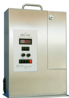
粉体エアロゾル発生器 エアロゾルジェネレーター(乾燥分散式) RBG 1000 G