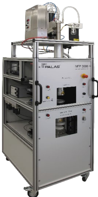
MFP 3000 G for ISO 16890