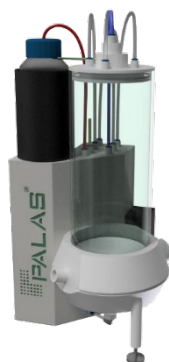
エアロゾル発生器 LSPG 16890