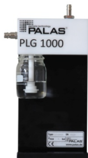
エアロゾル発生器 PLG 1000