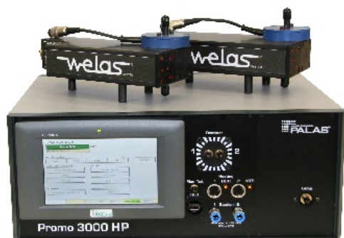
エアロゾルスペクトロメーター Welas 3000 シリーズ