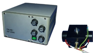
コロナ式エアロゾル中和器 CD 2000 ※LSPG 16890に取付