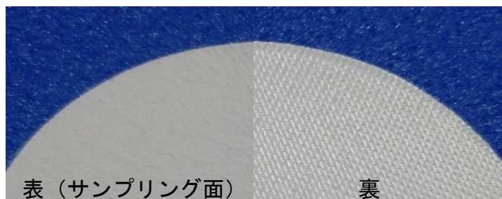
表（サンプリング面）