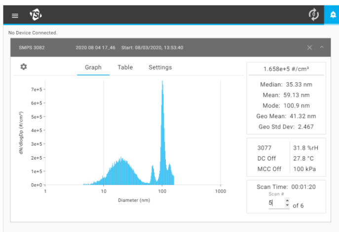
Figure.3 AIMソフトウェア (Ver11)

その他の機能として、多価帯電や拡散粒子ロスの補正、計測の開始/終了時間のプログラム化、データの自動保存などがあります。